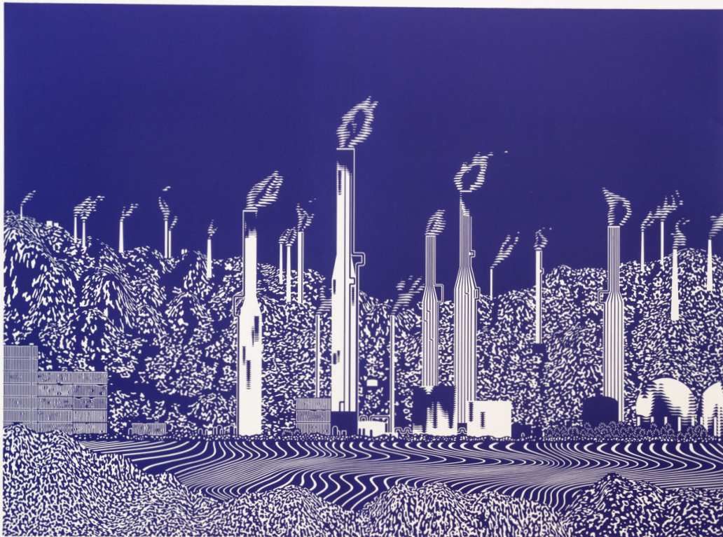
Frédéric Cordier, Parachem 2 , 2019, linogravure, 120 x 160 cm, 10 ex./ vélin d'Arches, URDLA imprimeur

Fin avril, URDLA présentera une rétrospective de l'artiste canado-suisse Frédéric Cordier. Fruit d'une collaboration singulière, cette exposition s'inscrit dans la continuité de quinze années de travail. Elle réunira vingt grands panoramas, chacun mesurant 120 x 160 cm, en linogravure, tirés et imprimés exclusivement à Villeurbanne sur l'une des dernières grandes presses Voirin encore en activité.