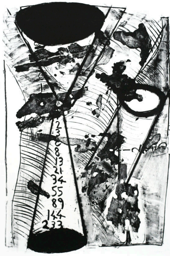
Mario Merz, Sans titre II , 1985, lithographie, 120 x 80 cm, 40 ex./ Creyesses, URDLA éditeur & imprimeur