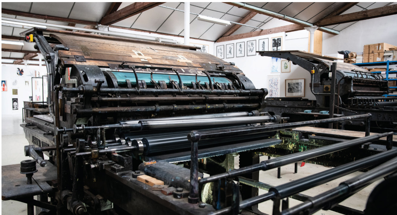
URDLA ©Cécile Cayon