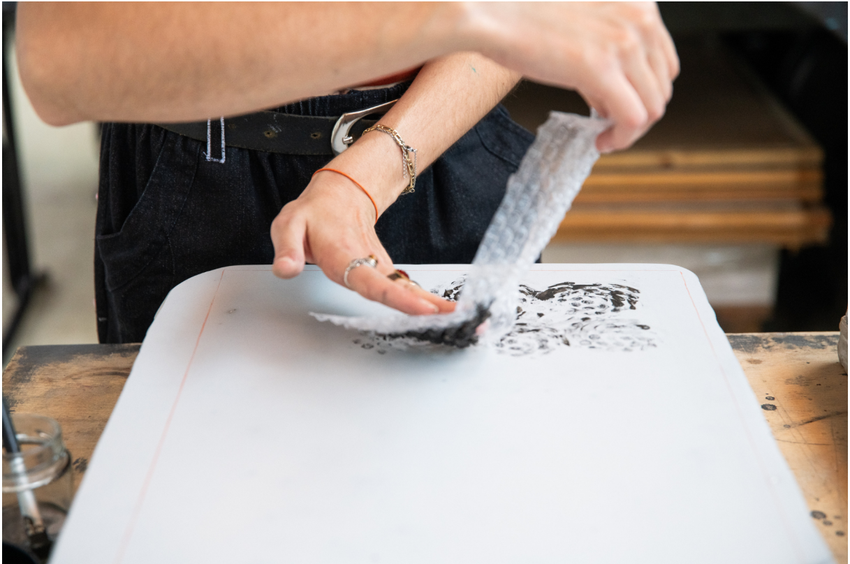
Lys Galatea à URDLA, Cécile Cayon ©