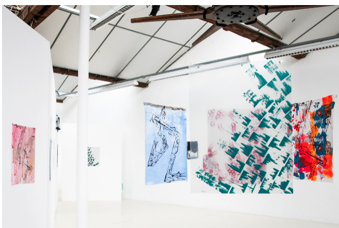
Exposition Empreintes de Lys Galatea par ©Cécile Cayon