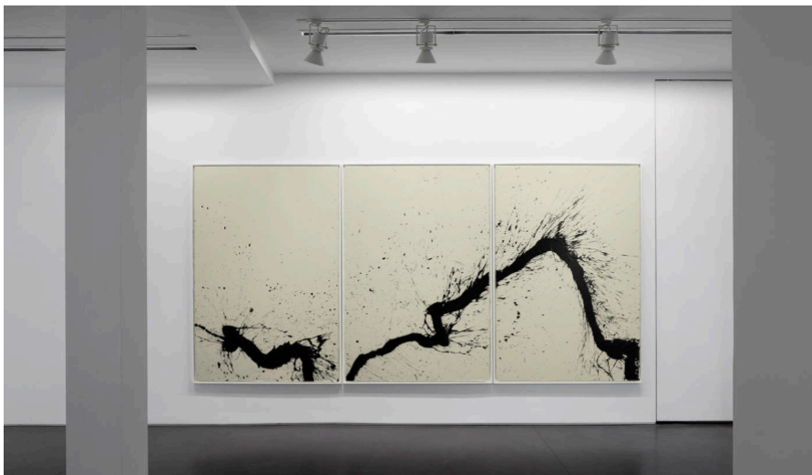
Fabienne Verdier, Walking-Painting, Solo n°04 , 2013, 198 cm x 134 cm

La série Walking-Painting, Solo n°04 est issue d'une série d'œuvres monochromes, pour laquelle l'artiste utilise un outil plus maniable – une grande réserve d'encre – au détriment de ses pinceaux traditionnels. Ceci lui permet de se déplacer librement au-dessus des feuilles préalablement préparées et étalées au sol. Ces peintures, dont l'exécution a été immortalisée dans un court métrage du même nom que la série, plonge le spectateur dans l'intensité du mouvement de la matière, et raconte le cheminement du processus de création de l'artiste, ainsi que sa recherche perpétuelle de mobilité et de monumentalité pour peindre en se déplaçant en toute liberté. La construction et l'équilibre de ses compositions, le rythme de ses gestes, ainsi que le choix de son médium ancrent l'œuvre de Fabienne Verdier dans l'esthétique chinoise et nous renvoie vers l'expressionnisme abstrait occidental.