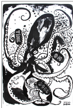
Damien Deroubaix, TIME GOES ON , 2024, lithographie, 120 x 80 cm, 20 ex./ vélin de Rives, URDLA éditeur & imprimeur

DU 25 MAI AU 20 JUILLET 2024, URDLA PRÉSENTE POLYMORPHIE DE DAMIEN DEROUBAIX & YANNICK VEY, EXPOSITION RÉUNISSANT LITHOGRAPHIES INÉDITES, DESSINS, PEINTURES ET SCULPTURES.