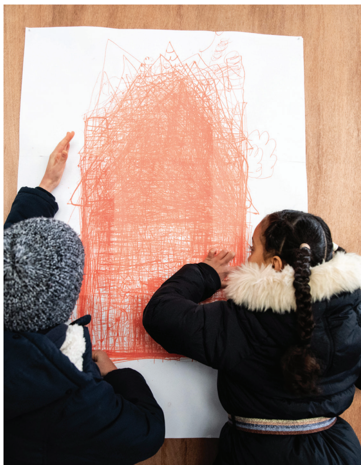
URDLA, école élémentaire Château Gaillard, Villeurbanne, © Cécile Cayon