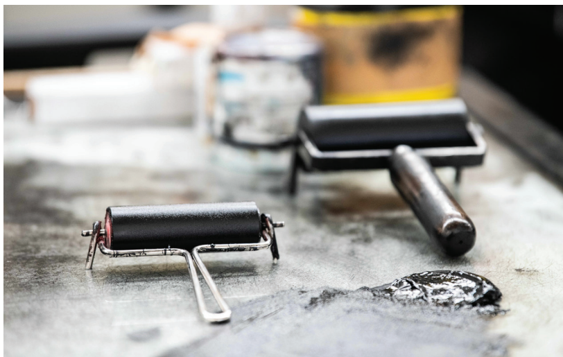
URDLA, Masterclasse Lyon

URDLA 207 rue Francis-de-Pressensé 69100 Villeurbanne, France 04 72 65 33 34 urdla@urdla.com, www.urdla.com