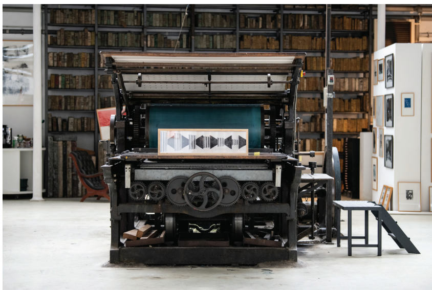
URDLA Lyon