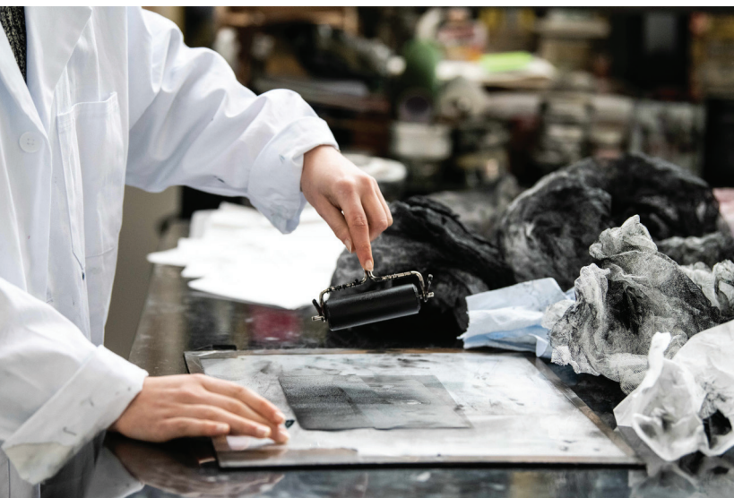
URDLA, Masterclasse Lyon